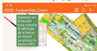
Figure 4.b : écran départ