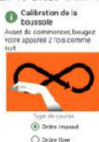
Figure 4.a : étalonnage boussole

À partir de maintenant, plus besoin d'avoir du réseau. Un écran d'étalonnage de la boussole apparaît (figure 4.a). Inutile de le faire à chaque fois. Vous pouvez choisir de parcourir le circuit en ordre libre ou imposé. Seul l'ordre imposé permet d'avoir une comparaison des performances sur le site. Une fois validé, vous arrivez sur l'écran du départ (figure 4.b).